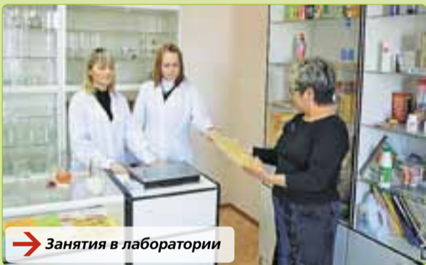
→ Занятия в лаборатории

Квалификация «Экономист-менеджер» помогает стать таким специалистом, который владеет современными