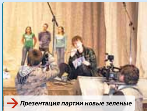
→ Презентация партии новые зеленые

Если вы готовы уверенно сказать «Да» всему вышесказанному, то добро пожаловать в ряды будущих специалистов по связям с общественностью.