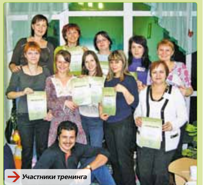
→ Участники тренинга

Студентам УРАО хорошо известен центр «Личный психолог», где проходят практические занятия, тренинги. У студентов-психологов есть возможность получить практические навыки, занимаясь с детьми, обучаясь профессиональным техникам консультирования НЛП, овладевая основами символдрамы, семейной и эмоционально-образной терапии.