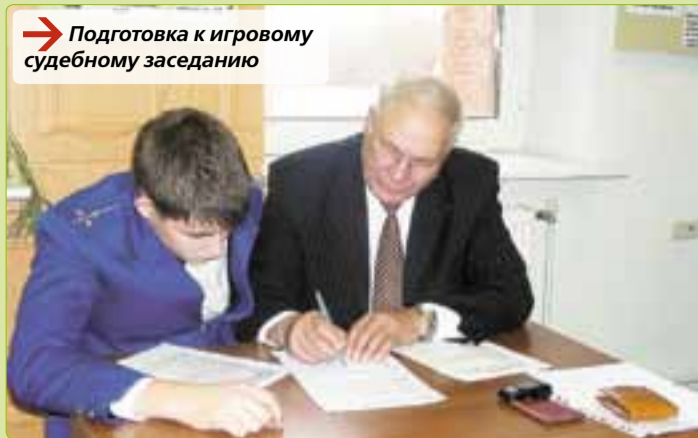
→ Подготовка к игровому судебному заседанию

Существует ошибочное мнение, что юрист знает абсолютно все законы. На самом деле, знать все существующее и постоянно меняющееся законодательство невозможно, да и практически нецелесообразно. Разумеется, в процессе профессиональной деятельности в зависимости от сферы работы часть норм законов действительно запоминается наизусть.